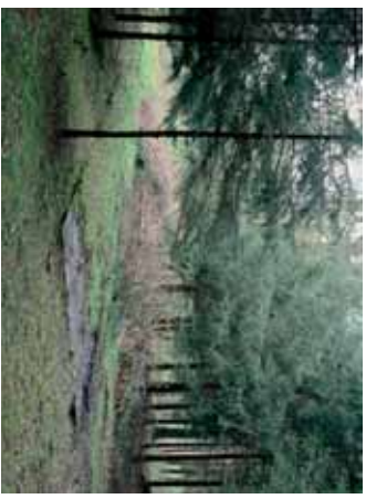
aus der 21teiligen Serie 6144-5145, Gunkskirchen (c-print, 60x70cm)

Von rund 15000 ungarischen Jüdinnen und Juden, die im Juni 1944 zur Kompensation des eklatanten Arbeitskräftemangels nach Öster- reich deportiert wurden – erfolgreiche Ver- handlungen eines jüdischen Rettungskomitees hatten sie von den Deportationen nach Öster- witz, die nach dem Einmarsch deutscher Trup- pen im März unter Leitung von Eichmann ein- setzen, ausgenommen –, wurden etwa 1200 ins Waldviertel transferiert, wo sie in 31 Wirt- schaftsbetrieben zwischen Juni 1944 und April 1945 Zwangsarbeit leisteten.